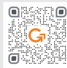
Unser Film zu Schraubprofilen